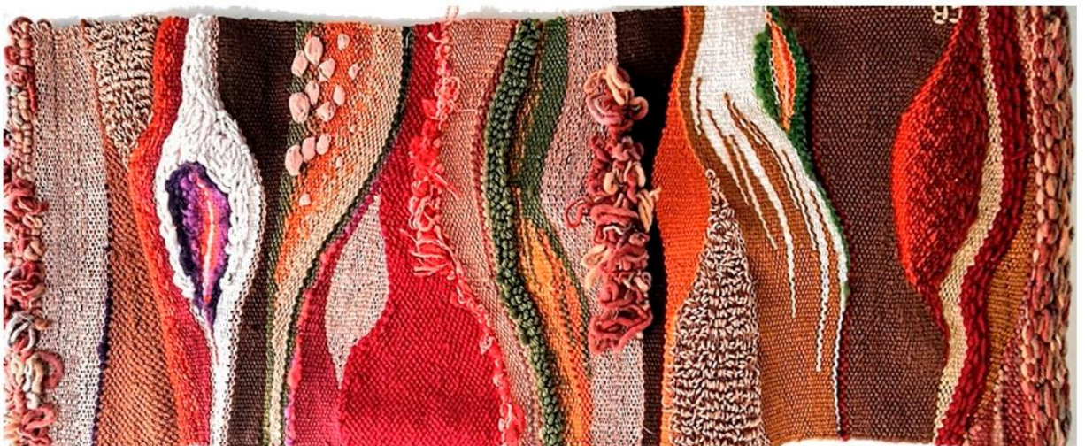
3. Cio da Terra 2021 tapeçaria c/ resíduos têxteis/fibras naturais 48 x 95 cm