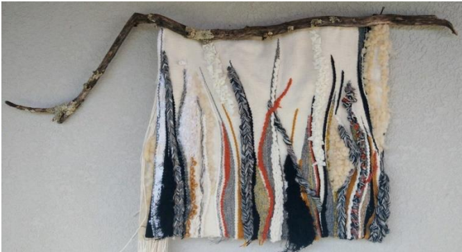
1. Floresta 2022 tapeçaria c/ resíduos têxteis/fibras naturais 120 x 75 x 7,5 cm