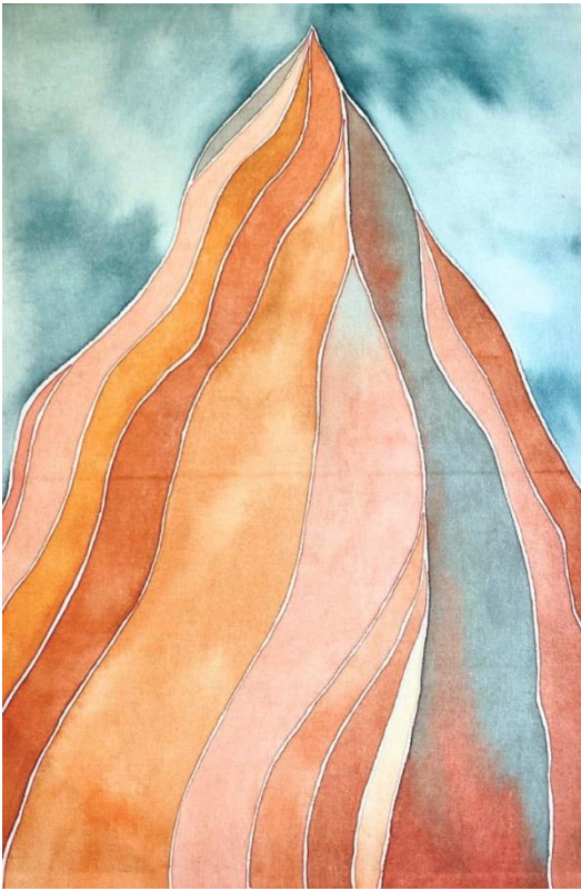
1. Geografia do Silêncio - Série 2025 aquarela sobre tecido - emoldurada 50 x 70 cm