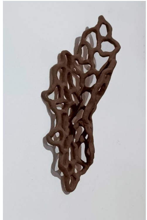
2. Dobra 2022 cerâmica/baixa temperatura 40 x 15 x 8 cm