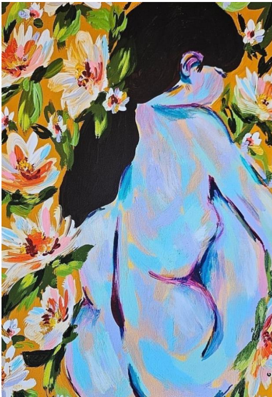
1. Garota no Jardim 2021 acrílica sobre tela 30 x 42 cm