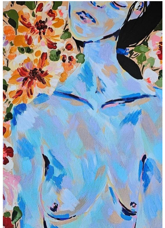
2. Meu Jardim 2021 acrílica sobre tela 30 x 42 cm