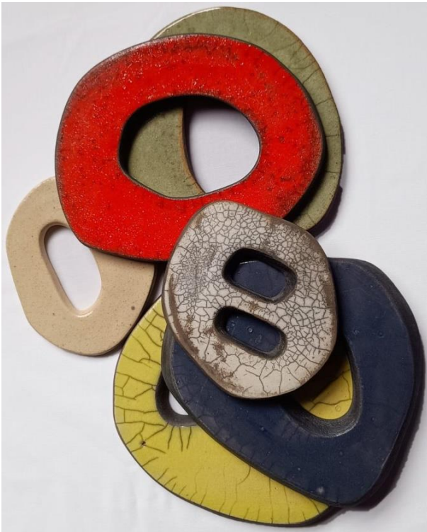
1. Brincaro 1999 escultura/cerâmica em Raku 28 x 18 cm (2 caixas c/ 3 peças cada)