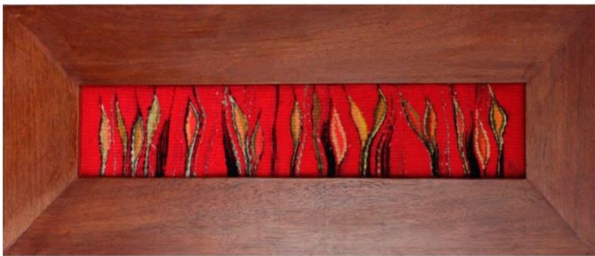
2. Salamandras I 2022 tapeçaria c/ resíduos têxteis/fibras naturais 85 x 30 cm